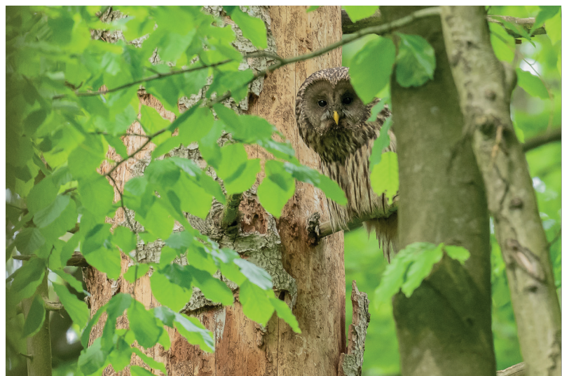
Puszczyk uralski (PS)